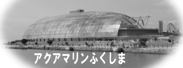
アクアマリンふくしま