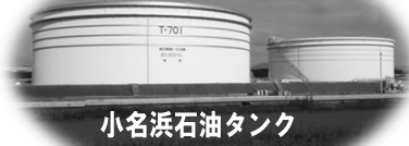
小名浜石油タンク