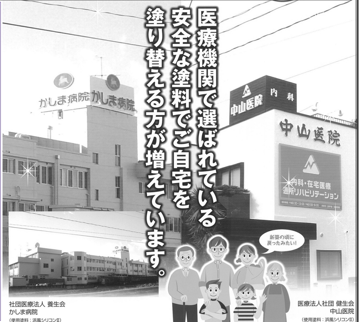
社団医療法人 養生会 かしま病院 (使用塗料：浜風シリコンII)