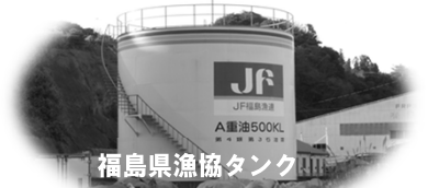
福島県漁協タンク