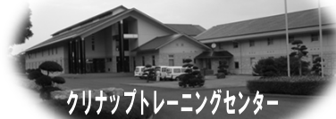
クリナップトレーニングセンター